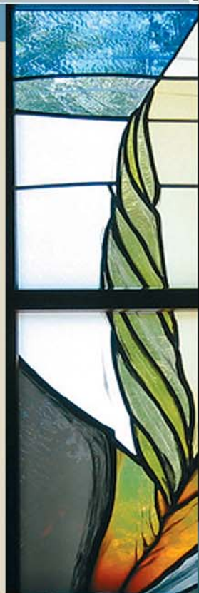
Стъклописците са на Сю Обата (Kanaga)

"света" и да бъде "преодоляване на света". Във външното си осъществяване, в продуктите на културата творческият акт е под властта на "света" и е скован от "света". Но творчеството, което е огнено движение из безкрайната свобода, трябва не само да възхожда, но и да низхожда, да предава на хората и на света това, което е възникнало чрез творческото прозрение, замисъл, образ, да се подчинява на законите за осъществяване на продуктите, на майсторството, на изкуството.