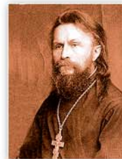
протоерей Сергий Булгаков