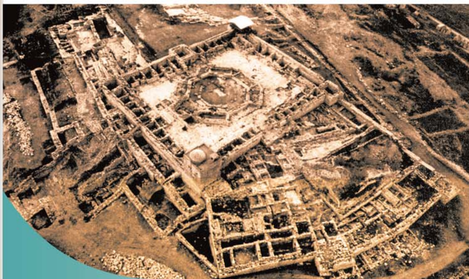
Хълмът Гаризин. В центъра са основите на византийската църква. В лявата част от църквата са централният вход и дворът, свързан със самарянския храм.

(края на II в. пр. Хр). Множество монети от периода на Йоан Хиркан I и Александър Велики са намерени на това място.