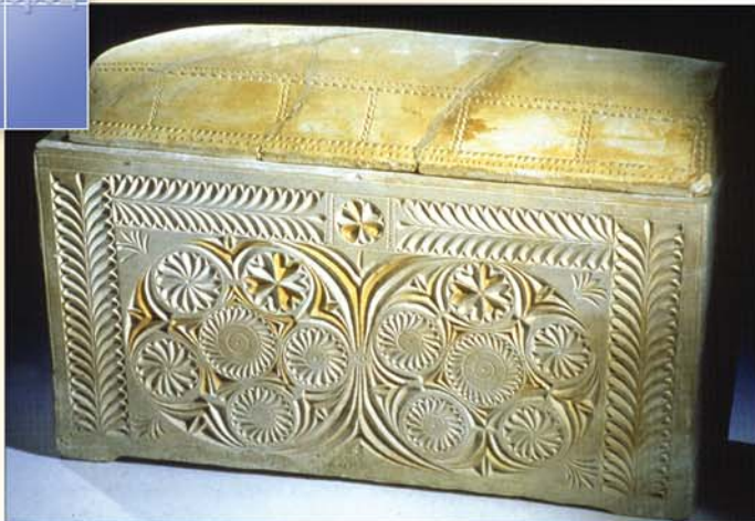
Тази костница (каменен ковчег) съдържа тленните останки на Йосиф Каяфа, първосвещеника, по време на който се провежда съдът над Исус.

Пилат Понтийски, Сергей Павел, Галион, Феликс, Фест.