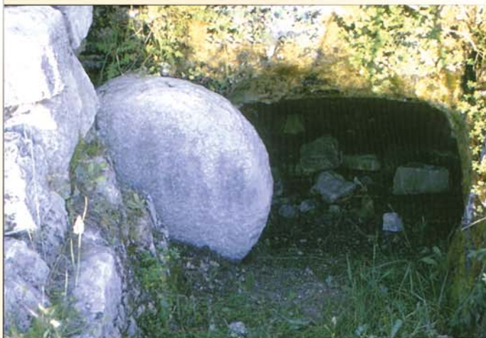
"А като повдигнаха очи, видяха, че камъкът беше отвален" (Марк 16:4). Това е камък, поставен пред гроб в Абу Гош, близо до Йерусалим.

Други извънбиблейски, нехристиянски древни източници, в които се споменава за Христос, са трудовете на езическите римски автори Корнелий Тацит (Анали, кн. 15, гл. 44), Гай Светоний (Божественият Клавдий, кн. 25) и Плиний Млади (Писмо до Траян), както и в юдейските равински предания.