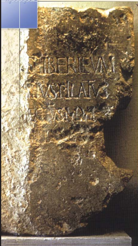
Надписът на този камък с размери 0,60/0,90 м, удостоверява името на Пилат Понтийски. Намерен е край древното селище Цезария през 1961 г.

Различни сведения в Новия Завет и други свидетелства посочват, че земното служение на Исус завършва на 3 април 33 г. сл. Хр., т.е. тогава е Неговото разпятие на Голгота. 2 Следователно хронологическите справки за Исус показват, че Той е автентична личност, живяла в конкретно историческо време.